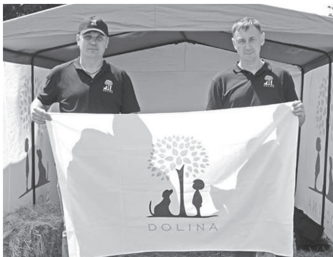
Група компаній DOLINA на Дні поля представила регулятори росту рослин та мікродобрива від вітчизняного виробника.