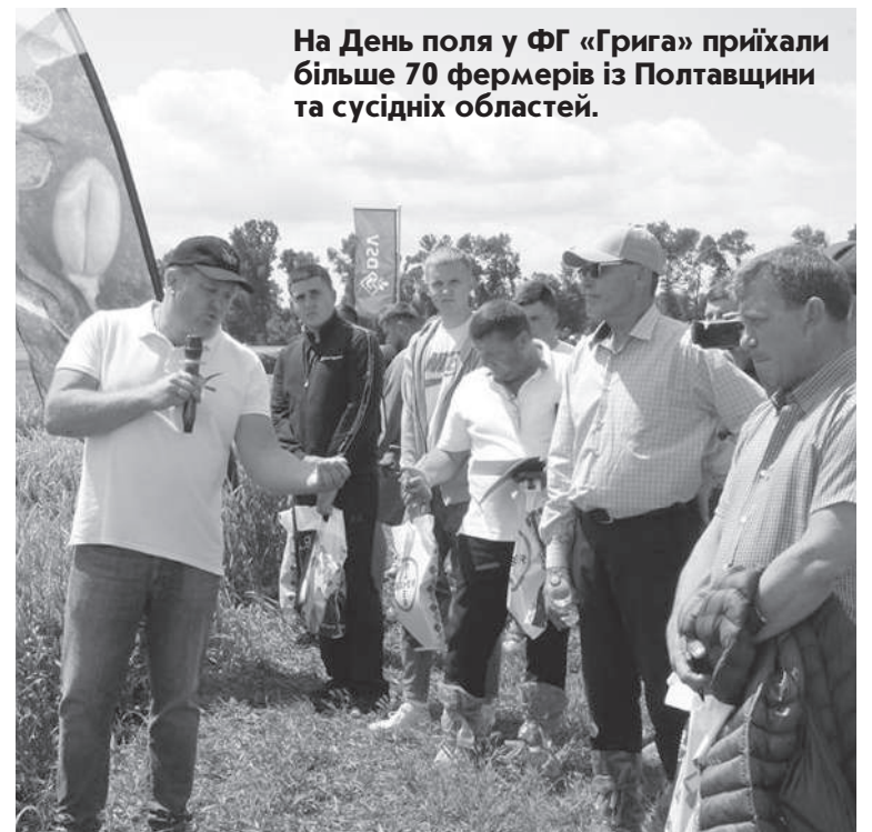
На День поля у ФГ «Грига» приїхали більше 70 фермерів із Полтавщини та сусідніх областей.